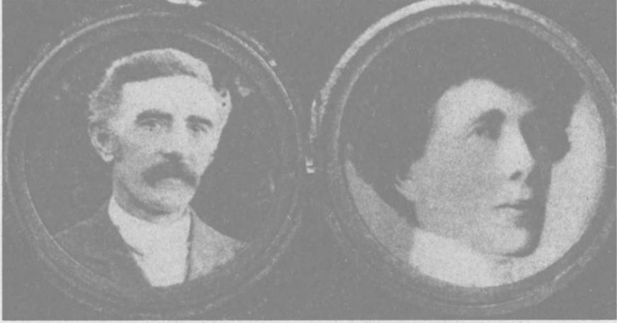
Van Gogh'un aşık olduğu Eugène Loyer ve Van Gogh'u kendisi için reddettiği Samuel Plowman

Hollanda'da bir çatı katında Van Gogh tarafından yazılmış romantik bir küçük hikaye bulundu. Hikaye, Van Gogh'un en sevdiği şiirlerden örneklerin yer aldığı bir albüme yazılmış, albüm de bir zamanlar Van Gogh'un kızkardeşi Lies'e ait bir sandığa konmuştu; orada keşfedildi.