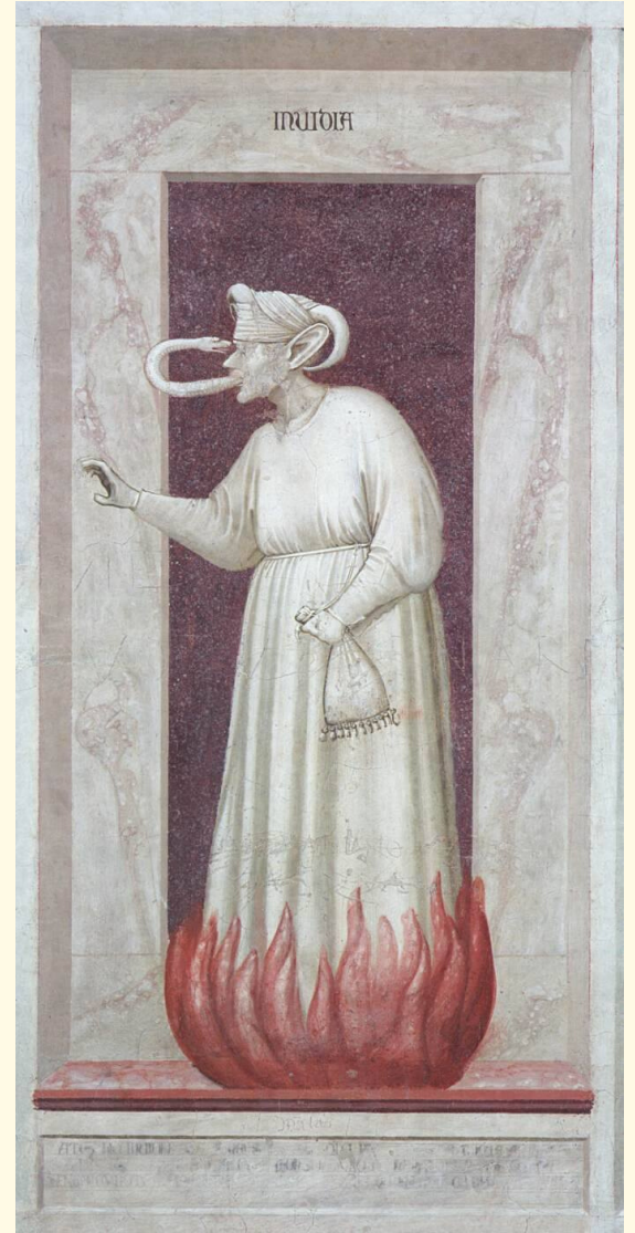
Giotto'nun Padua'daki Arena şapeli için 1304-1308 yılları arasında yaptığı, Yedi Erdem ve Yedi Günah alegorilerinden, Haset'i temsil eden resim. Haset, bir yandan öfkeyi ve ona atfedilen geleneksel olumsuz anlamları barındırdığından, ama asıl her türden bireyselleşmenin de önünü kapadığından, Giotto'nun dünyasındaki belki de en büyük günahı.