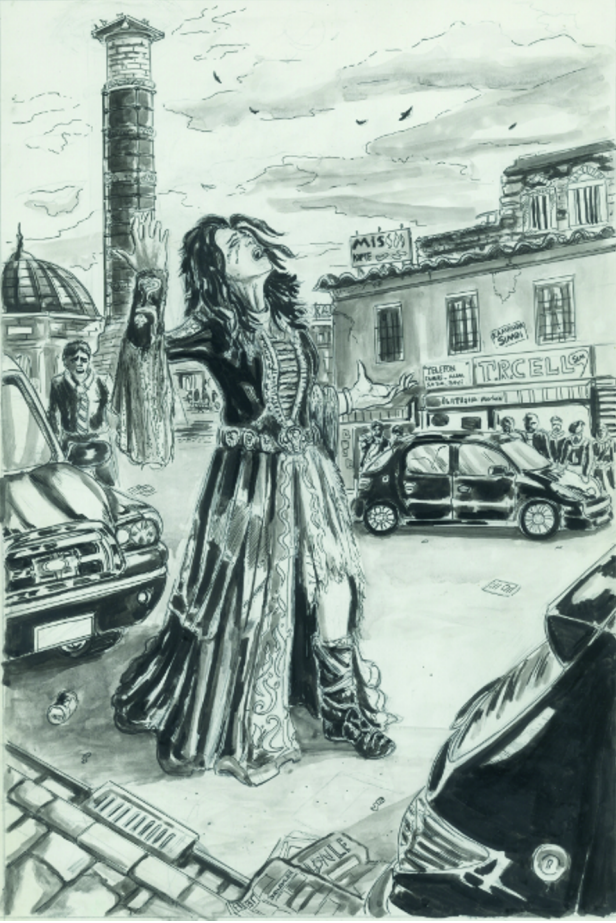
Gece Kraliçesi, Çizim: Fırat Bingöl

İlk baştaki kararlardan biri şuydu, bir süper kahraman gerekiyordu; çizgi roman dediğin şeyin bir süper kahramanı olması lazım. Söz konusu geçmişten gelen kahramanlar olduğunda, bu kahramanlar, çağırının haklarını savunan, onların sözcüsü gibi davranan, onların hamisi gibi davranan bir kimliğe sahip oluyordu. Mesela Gece Kraliçesi'ni bir anlamda İstanbul'un kendisini de temsil eden bir figür olarak düşündük. Gece kraliçesi doğrudan doğruya Mozart'ın Sihirli Flüt Operası'ndan alındı. Yani Fırat bayağı sihirli flüt dekorlarından çalıştı onu çizerken. Ama Gece Kraliçesi bir yandan da ölümden dönenlerin yani ölümün, karanlığın hakkını savunan bir figür.